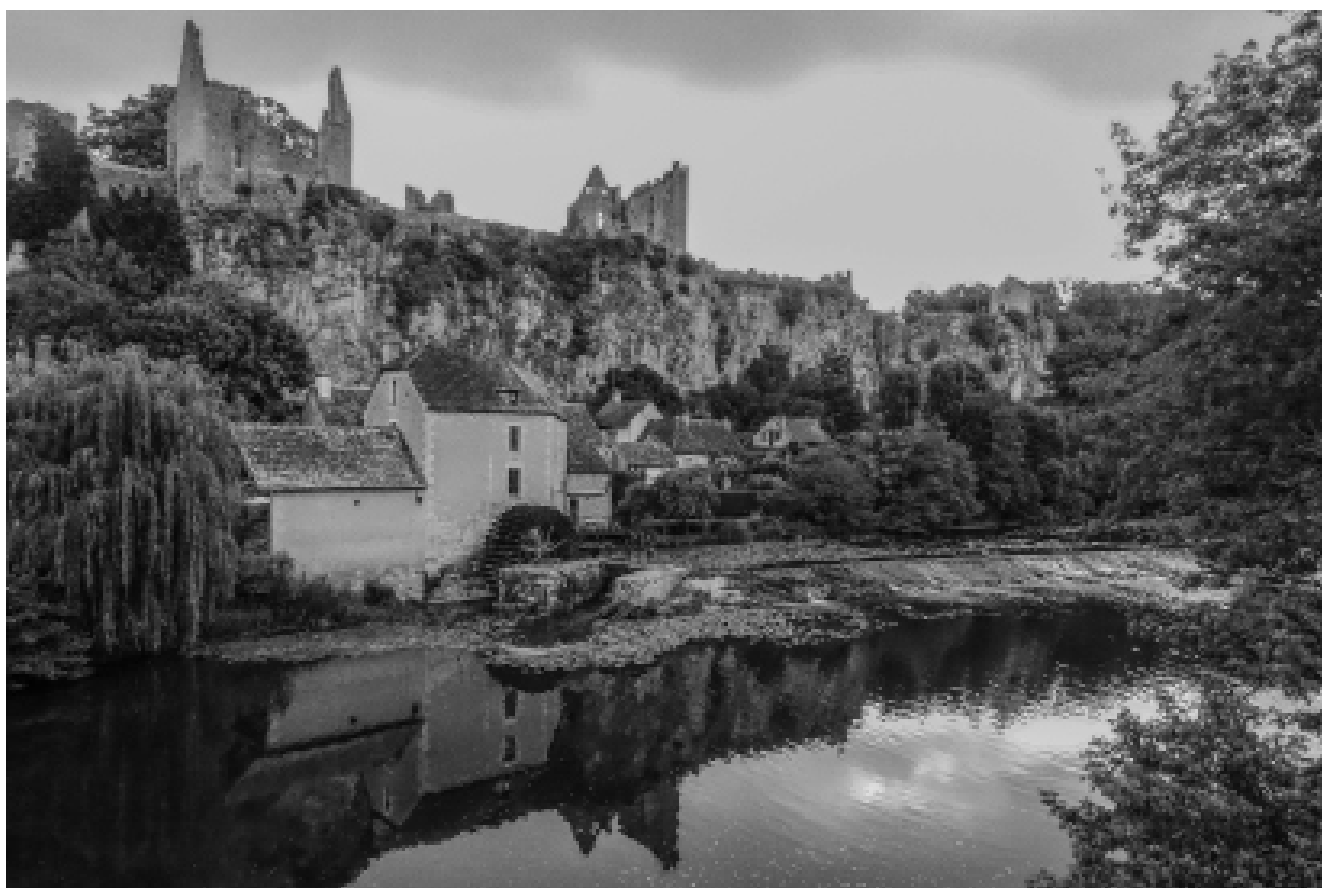
Angles-sur-l'Anglin dans la Vienne, classé parmi les plus beaux villages de France.