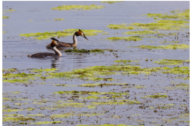
Grèbes huppés, canal latéral à la Loire.