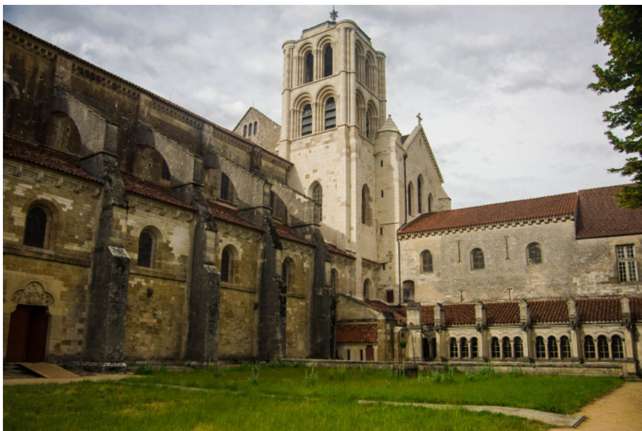
La basilique Sainte-Marie-Madeleine de Vézelay, haut lieu de pèlerinage au Moyen-âge est une étape importante sur le chemin menant à Saint-Jacques de Compostelle.