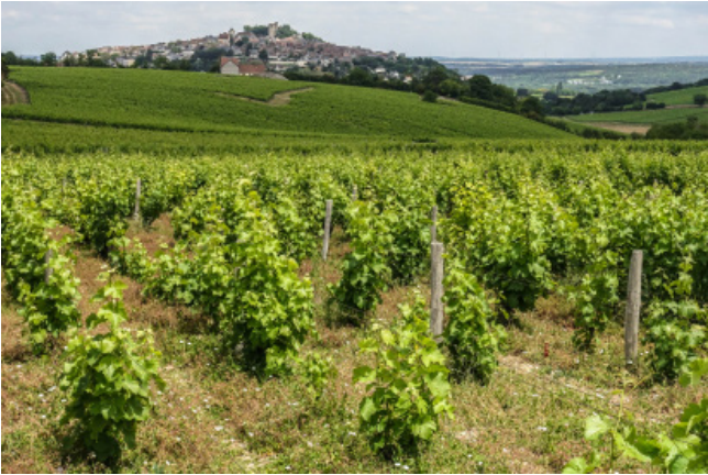
Les vignobles de Sancerre.