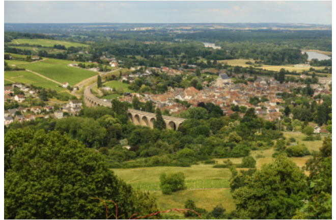
La commune de Saint Satur sur les bords de Loire.